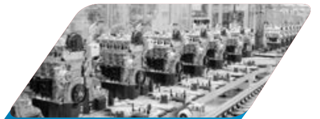
Audyty według wymagań VDA QMC